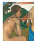
Le livre d'André Cariou