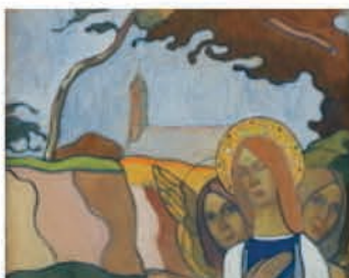
La Vierge aux deux anges

Quatre vingt tableaux, présentés par André Cariou, commissaire de l'exposition, qui signe un rare doublé avec le même talent, la même recherche, pour les textes du catalogue et du communiqué de presse.