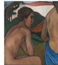
Homme nu assis devant un paysage