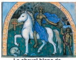
Le cheval blanc de l'Apocalypse