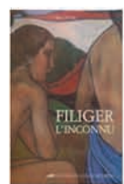
Le livre de Mira Jacob devenu rare on peut encore le trouver sur Internet