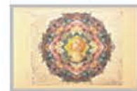
Notations chromatiques. Tête d'homme roux, ou Prométhée