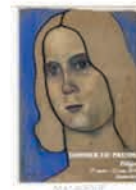
Le dossier de presse de Malingue