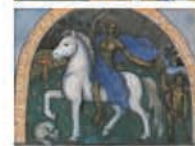
Le cheval blanc de l'Apocalypse