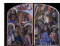
Le jugement dernier