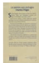
Le livre de Claire Daudin. Acheter ici