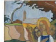
La Vierge aux deux anges