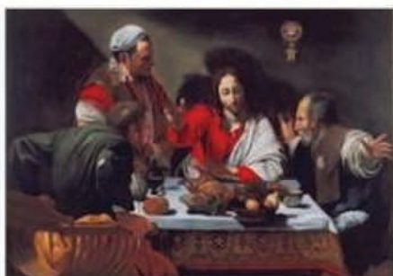
Le souper à Emmaüs

"Cardinal, ambassadeur de France à Rome de 1601 à 1605, Philippe de Béthune rencontre Michelangelo Merisi, dit le Caravage, admire sa peinture révolutionnaire pour l'époque et séduit par son style, lui achète quatre peintures originales. Elles sont détaillées dans un inventaire de 1608, où il recense l'ensemble de sa collection »