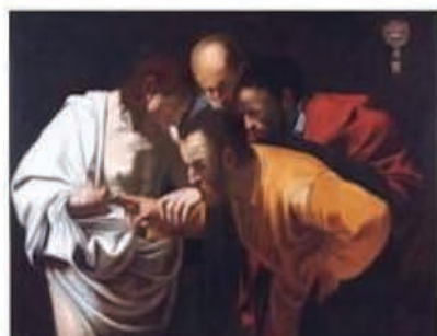
L'incrédulité de St. Thomas

Les tableaux identifiés authentifiés comme originaux se trouvent à la National Gallery de Londres et au château Sans-souci à Postdam