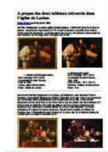
"Chefs d'œuvre en question"