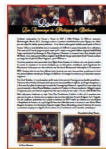
"Les caravage de Philippe de Béthune"