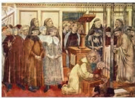
Crèche de Greccio par Giotto en 1298

La date du 25 décembre, telle que commémorée aujourd'hui n'a pas l'authenticité proposée par notre calendrier grégorien. le solstice d'hiver chez les Romains était le prétexte de grandes fêtes païennes nommées Saturnales et celle de (voir les tableaux d'Antoine François Callet (1741-1823), également la célébration de fêtes qui duraient de 3 à 7 jours, suivant les Empereurs « inversaient l'ordre des choses : les esclaves devenaient les maîtres et inversement » Mythologie romaine : Saturne. La fin du solstice d'hiver : symboliquement considéré comme la naissance du « soleil invaincu », où la lumière diurne se remet à croître. Interprété comme « le jour ou paraît le vrai » par les Chrétiens, d'où assise propice pour l'ancrage et le lancement d'une nouvelle religion.