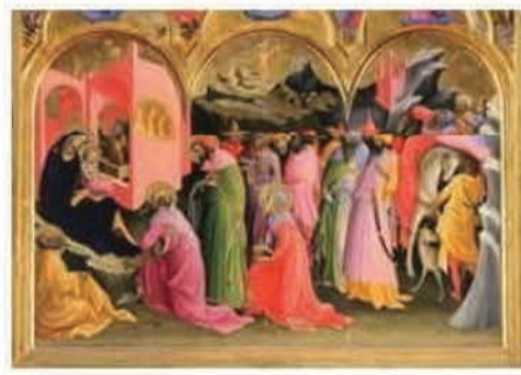
Lorenzo Monaco. L'adoration des mages. 1422

Il fallu du temps pour officialiser cette date : le pouvoir temporel, Constantin, fils d'Hélène, se convertit à la religion chrétienne après la bataille de Milvius en 312, où il vainquit Maxime qui tenait Rome. Le culte chrétien marginalisé, devint une religion officielle . En 354, le pape Libère, pouvoir spirituel, décréta le 25 Décembre jour de célébration de Noël pour toute la Chrétienté.