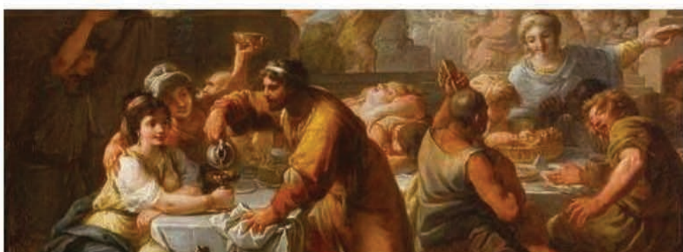
Antoine François Callet. "L'hiver ou Saturnales". 1783

Les 12 coups de minuit, délestant les clochers, sont attendus par des foules planétaires, animées de croyances, d'attente, d'espérance en des jours meilleurs. Les réjouissances peuvent commencer, l'année passée devient souvenir, quant au futur on y pensera plus tard.