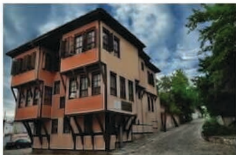
maison de Lamartine devenue petit musée

« Les Capitales européennes de la Culture constituent des ponts à l'heure où s'érigent des murs. Veillons ensemble sur les bâtisseurs de ponts », conclut Jack Lang .