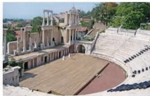
Théâtre romain de Plovdiv