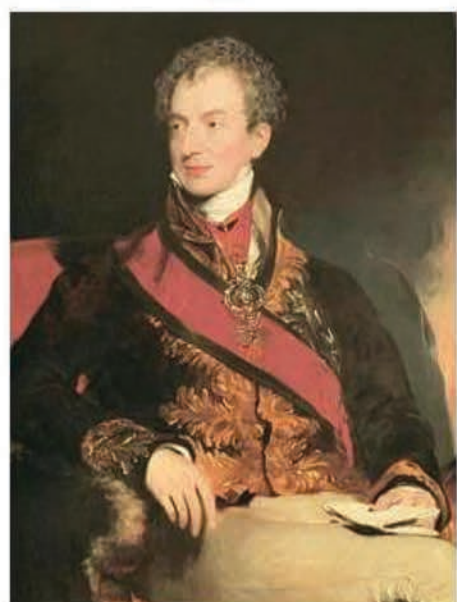
Klemens Wenzel von Metternich (1773-1859) par Sir Thomas Lawrence (1769-1830)

« La question Suisse ? Elle est dans les mains de Metternich, mais Talleyrand doit l'approuver »