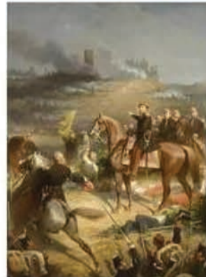
Napoléon III à Solferino par Adolphe Yvon (1817-1893)