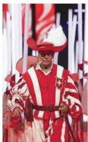
Commandant des cent-suisse en tenue de 1819