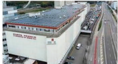
Ports francs et entrepôts de Genève

Genève, ville enserrée, ne pouvant compter sur un pays lui même exigu, il lui fallait assurer des échanges hors de son périmètre. Ses foires étaient connues depuis 1262, sa position géographique lui assurait l'accès des pays européens. Ce qui attira du commerce de gros, puis le négoce international : géants du grain, pétrole brut et succédanés, produits alimentaires ...Face à cet afflux de marchandises, il fallut construire, ce fut l'origine du Port Franc et des Entrepôts de Genève en 1888.