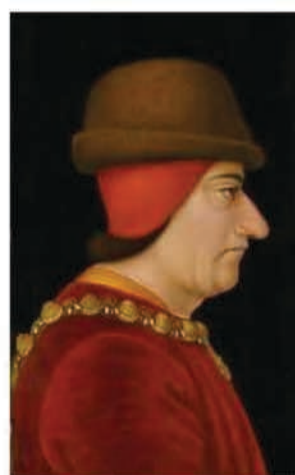
Louis XI (1423-1483) par Jacob de Litemont en 1469

Le 20 Mars 1815, 3 mois avant Waterloo, les puissances signataires du Congrès de Vienne, assuraient à la Suisse une « reconnaissance formelle et authentique de sa neutralité et une garantie de l'inviolabilité de son territoire » Clause particulière 19 Mai 1815, qui incluait « la République de Genève ». En France, on vivait la période les Cent-Jours, Napoléon venait de débarquer à Golfe-Juan et marchait sur les Tuileries, tandis que Louis XVIII et son gouvernement se réfugiaient à Gand