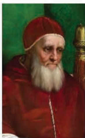
Jules II (1443 - 1513) par Raphaël (1483-1520)