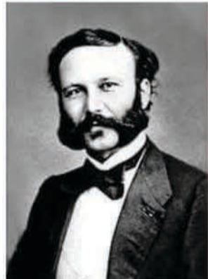
Henry Dunant 1828-1910) Prix Nobel 1901