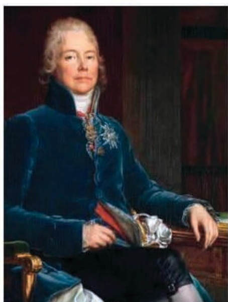
Charles Maurice de Talleyrand Périgord (1754-1838) par François Gérard (1770-1837)

Le 20 Mars 1815, 3 mois avant Waterloo, les puissances signataires du Congrès de Vienne, assuraient à la Suisse une « reconnaissance formelle et authentique de sa neutralité et une garantie de l'inviolabilité de son territoire » Clause particulière 19 Mai 1815, qui incluait « la République de Genève ». En France, on vivait la période les Cent-Jours, Napoléon venait de débarquer à Golfe-Juan et marchait sur les Tuileries, tandis que Louis XVIII et son gouvernement se réfugiaient à Gand