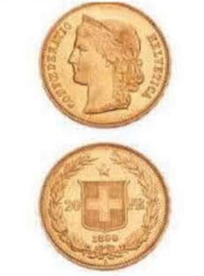
Pièces de l'union latine Première union monétaire de l'histoire

Ce fut Solferino en 1859, Français et Piémontais s'unissaient pour soutenir l'unité italienne contre l'Autriche opposée à cette perspective. Si la coalition de Napoléon III gagna, une autre personnage restera dans l'Histoire: Henri Dunant 31 ans, genevois, homme d'affaire protestant, était de passage dans cette région. Il vit ce carnage et avec de maigres moyens entreprit de soigner les blessés des deux camps. Une première sur un champ de bataille et action fondatrice en 1875, du Comité International de la Croix Rouge.