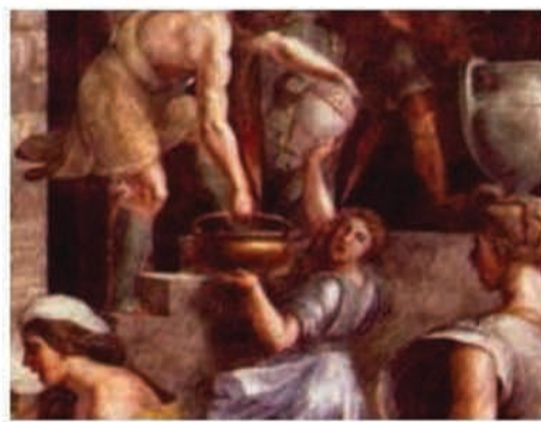
L'incendie de Borgo (extrait)

Le Cardinal Jean de Médicis, succéda au Pape Jules après moult intrigues, devenant Pape à 38 ans sous le nom de Leon X ... tout naturellement Raphaël devint son peintre favori, poursuivant les décors des chambres, assurant la succession de l'architecte Bramante pour la construction de la basilique St Pierre. Sa célébrité devenant une constante de sa vie, il lui fallut embaucher : près de cinquante artistes peintres fréquentaient son atelier, un vrai businessman pour des œuvres qui s'arrachaient.