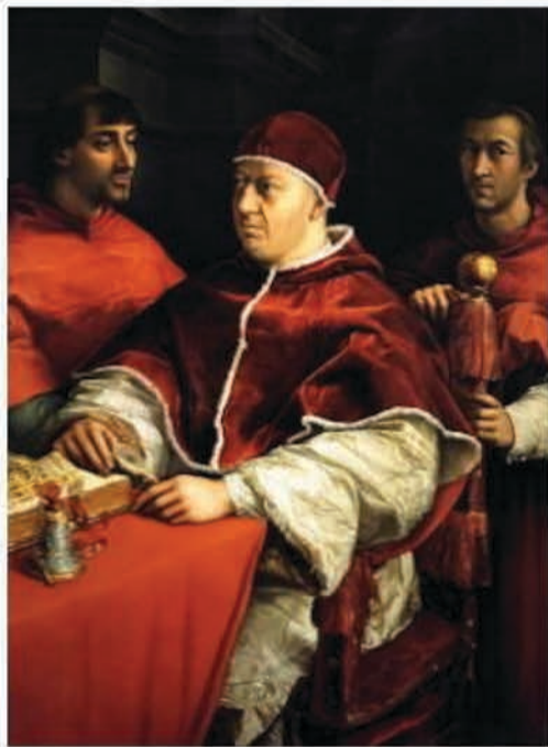
Léon X (portrait 1518-1520)

Le pape Jules II (1443-1513), "l'inventeur" des Gardes Suisses, le convoqua à Rome et lui confia la décoration des ses appartements du Vatican, les fameuses 4 chambres (stanzas): de la Signature (destinée au Tribunal de la Curie), d'Héliodore, de Constantin, de l'incendie de Borgos. Le sublime auquel Michel Ange parvenait par son ardeur et sa passion, Raphael l'obtenait par un équilibre souverain entre intelligence et sensibilité.