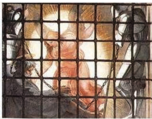
La délivrance de Pierre (extrait)

Les ducats d'or ou d'argent ne suintaient pas des murs et voûtes décorées... avec, de surcroît, les guerres d'Italie.