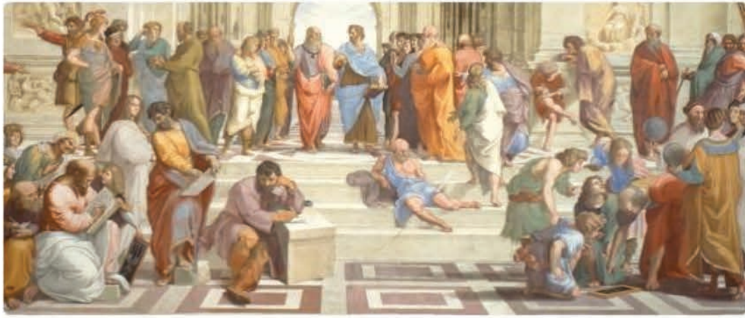
L'école d'Athènes (extrait) 1508-1512

Cette année, nous commémorons le 500 ème anniversaire de son décès, l'occasion pour le musée Condé de Chantilly de proposer une exposition hommage intitulée : "Le Maître et ses Élèves" du 7 Mars au 5 Juillet 2020.