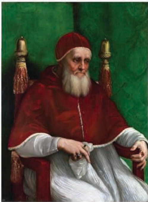
Jules II (portrait 1511-1512)

Très jeune, 11 ans, il fit preuve de dispositions particulières pour la peinture et ses relations familiales lui permirent d'accéder à l'atelier du Pérugin. Raphaël assimila rapidement la technique de son maître et partit pour Florence. Léonard de Vinci et Michel Ange y travaillaient déjà. Raphaël s'appliqua à sortir une série de Madones... une influence de Léonard est bien présente.