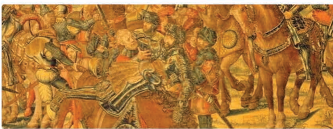
Le Roi est fait prisonnier à Pavie. Tapisserie de Bernard Van Orley (1525-1531) (détail)

1526 : François 1er , fait prisonnier par Charles Quint à Pavie, obtient sa libération contre une rançon de 1 200 000 écus d'or à venir. Il propose en otages ses deux fils, le Dauphin François , 8 ans et son cadet Henri , 7 ans. L'échange se fait sur l'île aux Faisans, les deux enfants partant pour une sévère captivité qui dura 4 ans.