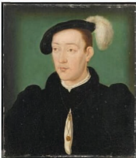
"Messieurs les enfants" 6 ans après leur libération. Portraits de Corneille de Lyon en 1536

1530 : retour sur l'île de " Messieurs les Enfants" et règlement de la rançon. Le décompte fut laborieux, la teneur en or de certaines pièces ne respectant pas la valeur nominale. Éléonore d'Autriche , sœur de Charles Quint, promise au Roi de France, était présente.