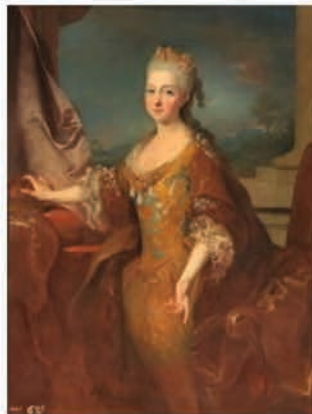
Mademoiselle de Montpensier par Jean Ranc, 1724.