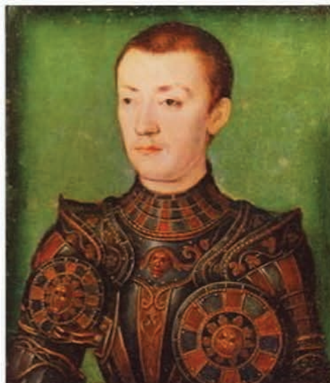
À gauche l'aîné François, ci-dessus le cadet Henri qui deviendra roi de France. (Henri II)