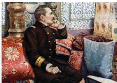
P. Loti, Capitaine de Vaisseau. Vice-roi en 1891.