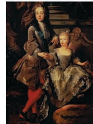
Louis XV et Marie Anne Victoire par François de Troy, 1723.

1722 : Pour mettre un terme à une énième guerre; toujours sur l'île, nouveau recours à des mariages croisés. Cette fois il s'agit de marier Louis XV , 11 ans et Marie Anne Victoire , 4 ans, fille du roi d'Espagne Philippe V...et en même temps Mademoiselle de Montpensier , 12 ans, la fille du Régent au futur Louis I d'Espagne, 15 ans.