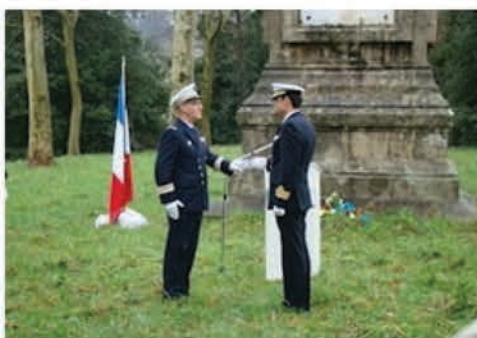
Passation de pouvoir "moderne" entre Vice-rois

2019 : Le titre de vice-roi est toujours usité, du 1er Janvier au 30 Juin, l'île est espagnole. Elle est, française du 1er Juillet au 31 Décembre. Clin d'œil à une République qui décapita son roi et sa reine, "une parité" en avance sur son temps.