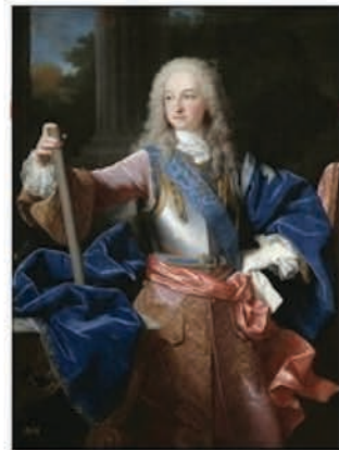
Louis I d'Espagne par Jean Ranc, 1723.

1859 : l'impératrice Eugénie (d'origine espagnole) inaugure une stèle commémorative des 200 ans du traité des Pyrénées sur l'îlot des Faisans.