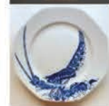
Une des assiettes pour le restaurant Prunier