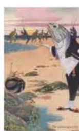
Lewis Carroll "Alice au pays des merveilles" chapitre "le quadrille des homards"