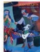
Jean Hélion Affiche de "La saga aux homards" pour les expos de Morlaix et Vannes.