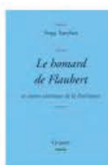
Serge Sanchez "Le homard de Flaubert" Télécharger l'extrait proposé par le Télégramme ©