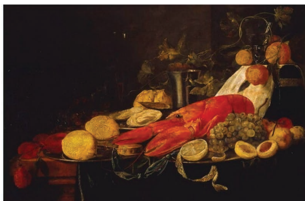
Jan Davidszoon de Heem (1606-1684). Nature morte au homard (1648)

Chacun s'exprimant sans concession sur cet événement inattendu, nous avons choisi le monde des Arts, pour suivre les artistes et leur manière de traiter ce "fruit de mer" quand, sorti de son trou d'eau, il ne maîtrise plus son destin.