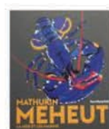
Mathurin Méheut "le homard bleu"