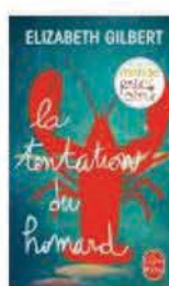
Elizabeth Gilbert "La tentation du homard" Couverture et résumé