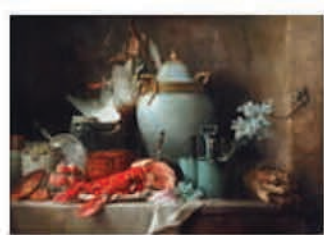
Anne Vallayer-Coster (1744-1818) Vase, homard, fruits et gibier. (1817)