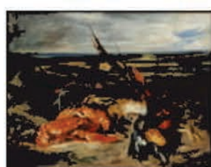
Eugène Delacroix (1798-1863) Nature morte aux homards (1827)