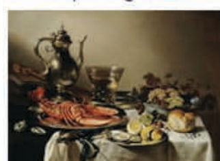
Pieter Claesz (1597-1661) Nature morte avec argenterie et homard. (1641)

Il convient de citer Anne Vallayer-Coster mais aussi le plus célèbre, le romantique Eugène Delacroix