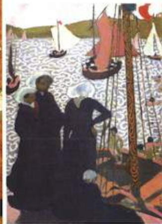
«Régates à Perros-Guirec» En dépôt au Musée de Quimper