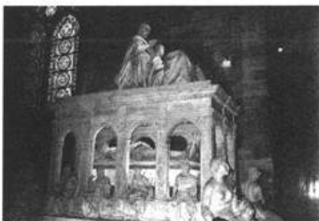
Le tombeau de Louis XII et Anne de Bretagne

38 ans, priant près de son deuxième époux, Louis XII, tournée vers l'est, yeux grands ouverts (symboles rappelant la foi en la résurrection, et la lumière céleste). Elle est belle, nue mais pudique, sa chevelure étalée la pare de grâce.