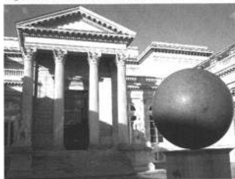
La sphère des droits de l'homme

Il est quant à lui plus austère et plus imposant. Nous traversons la Salle des pas perdus avec son plafond d'Horace Vernet, puis le Salon de Casimir Périer avec son bas-relief en bronze représentant la riposte de Mirabeau à la séance des Etats