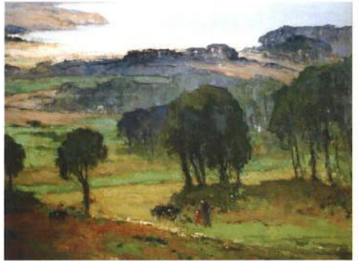
Désiré Lucas «La baie de Douarnenez» Musée des Bx-arts de Brest

G éographiquement : unique A voir à marée basse seulement V éritable paysage mégalithique R ésistant depuis plus de mille ans I ncroyable site, indécélable en haute mer N écropole sous-marine extraordinaire I ndifférente aux tempêtes et marées S urgissant à chaque basse mer, vous laissant toujours émerveillés.