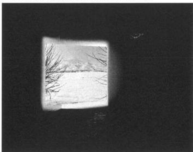
Sophie Ristelhueber - L'air est à tout le monde, 2000 - Image projetée

Le Quartier accueille deux expositions personnelles qui abordent, chacune de manière différente, l'expérience de la réalité. Les photographies et les installations de Sophie Ristelhueber déconstruisent les représentations médiatiques des guerres et territoires en conflit (Beyrouth, Koweït, Irak...). L'artiste pose un regard intime sur des détails prélevés au cours de ses voyages en Asie Centrale et au Proche Orient.